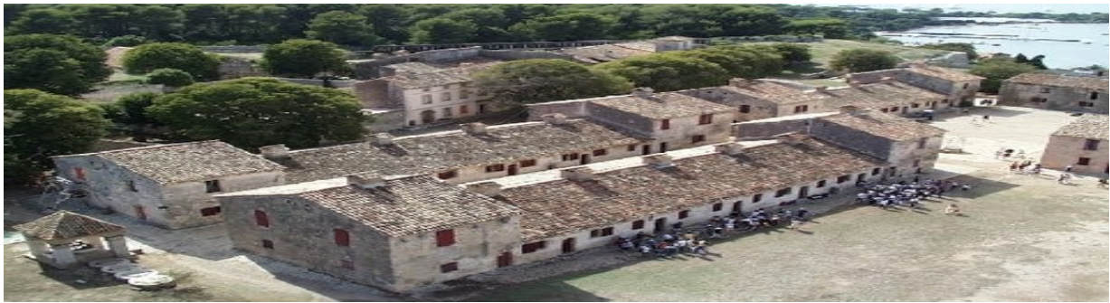
L'intérieur du fort royal