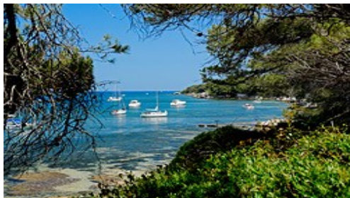
Un cadre dépay sant...