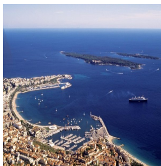
la baie de Cannes