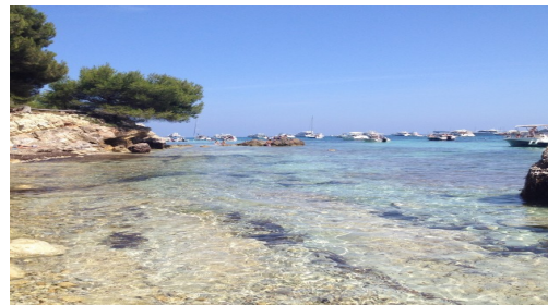
Un décor plutôt agréable...

N' hésitez plus et rejoignez nous pour une semaine alliant convivialité, détente, échecs dans un cadre paradisial!