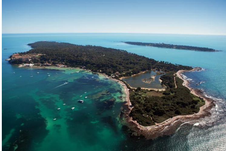
Ile Sainte Marguerite

(Places limitées aux 80 premiers inscrits)